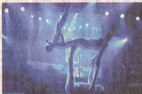
Akrobat blau: Phantastische Körperbeherrschung zeigt die Artistik Company aus Köln.