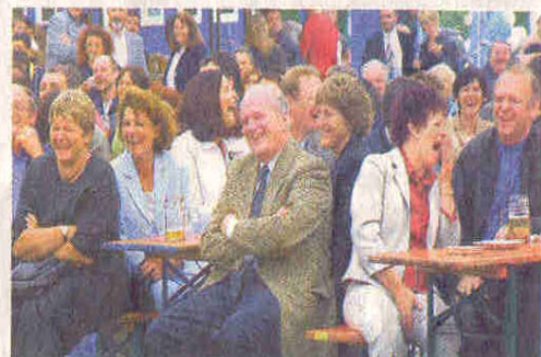
Wenn einer oben auf der Bühne leidet, haben die unten am Bier-tisch was zu lachen.

Die ganze Belegschaft kommt: 200 Jahre Unternehmenskultur ist auch am Standort Singen eine große Feier wert