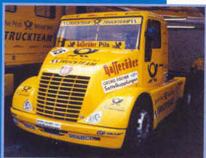
Verkehrstechnik Truck Racing