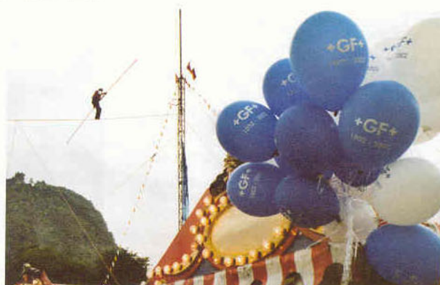
Abwechslung und buntes Treiben auf dem Festgelände: Alexi Kubly auf dem Hochseil.

Schon beim Betreten des Festgeländes auf dem ehemaligen Landesgartenschauengelände wurden die Gäste freundlich vom Servicepersonal mit einer Auswahl von Getränken empfangen, und wer wollte, konnte den ersten kleinen Hunger mit belegten Brötchen stillen.