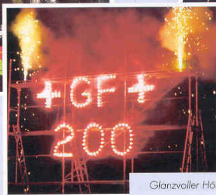
Glanzvoller Höhepunkt: Lichtbild und Feuerwerk.