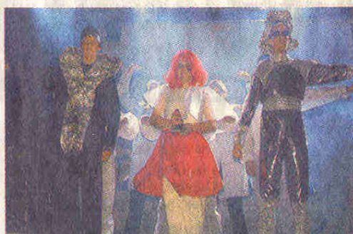
Auf die Georg-Fischer-Welt im Jahr 2222 haben die Auszubildenden die Singener Belegschaft vorbereitet.