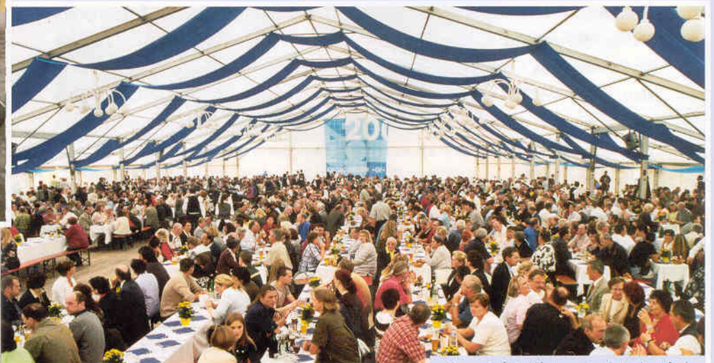
Kaum ein freier Platz war im Festzelt zu finden.