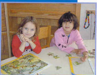
Rohrverbindungstechnik Spende für Kinderheim