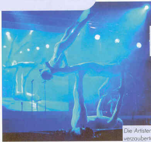
Die Artisten der Artistik Company verzauberten das Publikum.