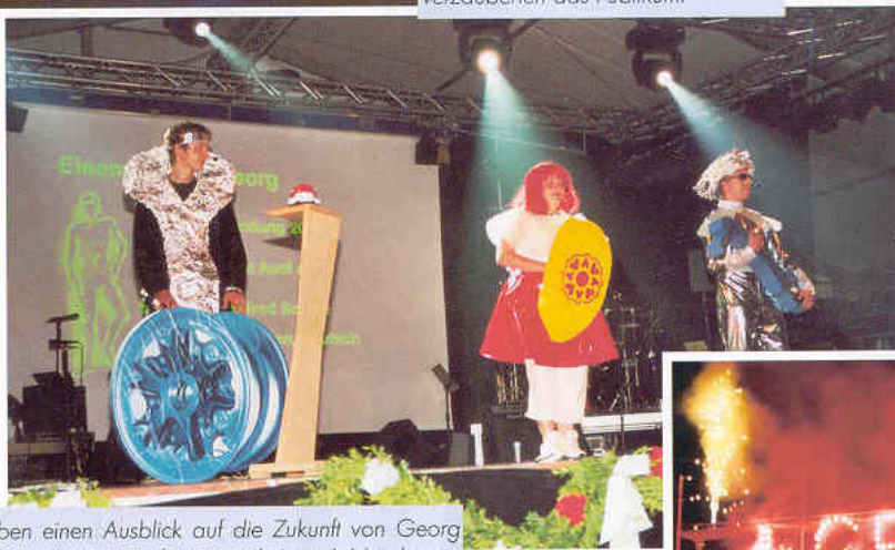
Gaben einen Ausblick auf die Zukunft von Georg Fischer: junge Mitarbeiter und Auszubildende aus dem Unternehmen.